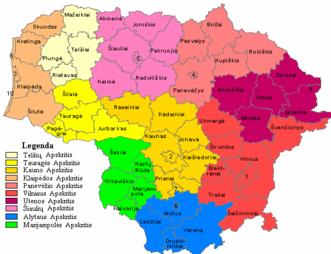
Schema Nr. 1. Lietuvos apskritys ir savivaldybės

Lietuvos savivaldybėms įstatymas nurodo 14 savarankiškųjų funkcijų. Tai - savivaldybės biudžeto sudarymas ir tvirtinimas; ikimokyklinis vaikų ugdymas; vaikų ir jaunimo papildomas ugdymas bei užimtumas, profesinis mokymas; suaugusiųjų neformalusis švietimas; maitinimo paslaugų teikimas ikimokyklinio ugdymo bei bendrojo lavinimo įstaigose; socialinių paslaugų įstaigų, steigimas, išlaikymas ir bendradarbiavimas su visuomeninėmis